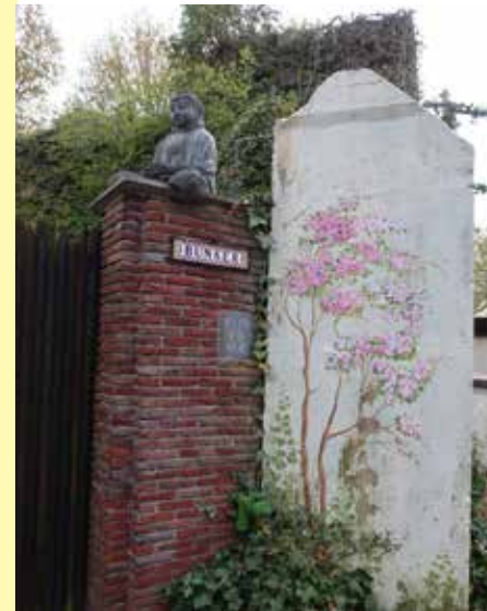
Met bloemen beschilderde muur van een nog bestaande bunker. Op de bakstenen zuil van de poort siert in tegels het woord 'Bunker'. Het Boeddhabeeld doet de oorlog hier vergeten

Ook van deze stelling zijn de meeste bunkers gesloopt voor de aanleg van woonhuizen en de Koningin Julianaweg. Van de tien bouwwerken resteren er nog maar een paar. Bij de opzet van de wijk Tuinveld in 's-Gravenzande werd de geschiedenis van de Tweede Wereldoorlog echter niet vergeten door een van de straten de 'Gedempte Tankgracht' te noemen. Eén van de nog resterende bunkers is mooi beschilderd en de eigenaar heeft hierin een minibioscoop met openhaard en op het dak een sauna met terras gemaakt. Om privacy redenen fietsen we hier voorbij.