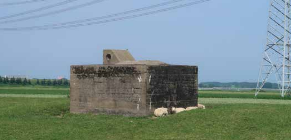
Telefoonschakelbunker op de dijk