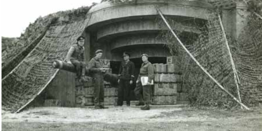
Geschutsbunker van batterij Vineta in 1945