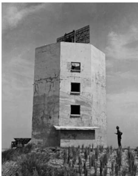
Radartoren Münze in 1945. Het radarscherm steekt boven de rand uit