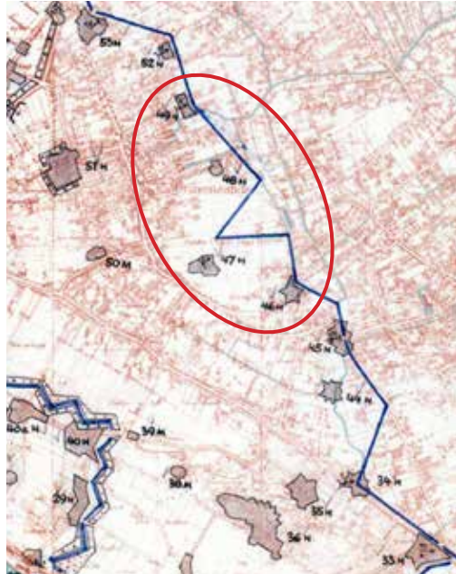
Kaartje van de Festung met genummerde stellingen aan de tankgracht in het Westland. 46 is de woning op de bunker, 47 Oranjepark, 48 Leeuweriklaan en 49 Boerenlaan

Sla RA en rij verder op de fietsstrook van de Koningin Julianaweg. Bij de tweede rotonde heet de weg naar rechts de Leeuweriklaan. Fiets er 50 meter in en kijk links.