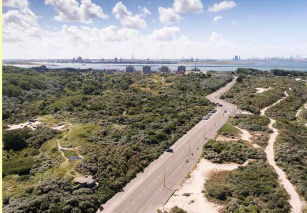
De Strandboulevard met rechts het opgespoten nieuwe duin. Linksonder is de Markostand zichtbaar en bij de knik in de weg links lag kustbatterij Vineta

Even verder, ter hoogte van de flauwe bocht in de weg zie je tussen de bosjes links een geschutsbunker. In de verte een aparte antenneconstructie.