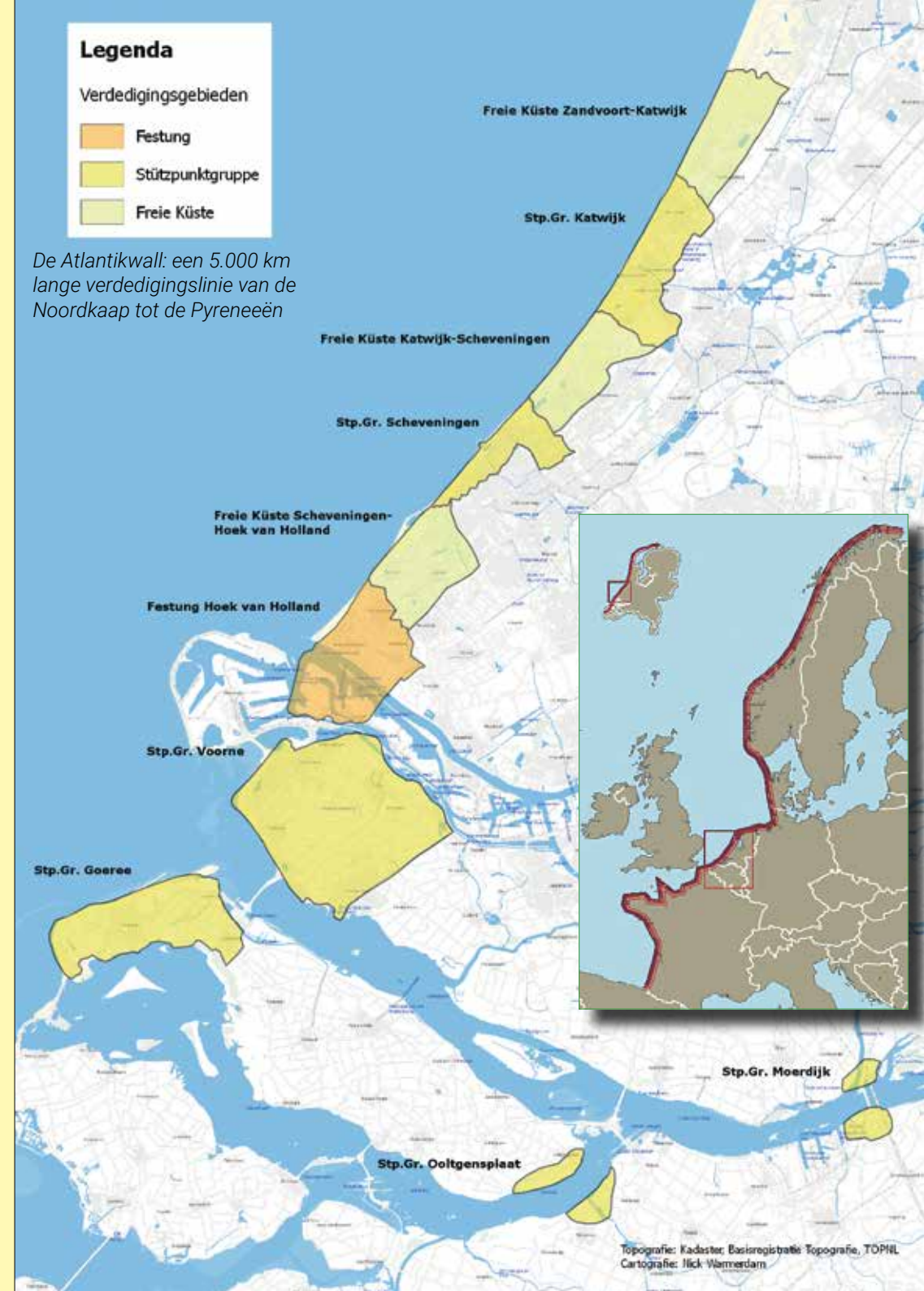
De Atlantikwall: een 5.000 km lange verdedigingslinie van de Noordkaap tot de Pyreneeën