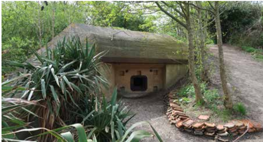
Geschutsbunker in de wandeltuin van Intratuin

Een deel van de bunkers van het complex bij Arendsduin is door Intratuin opgenomen in hun wandeltuin, tijdens winkelopeningstijden vrij te bekijken.